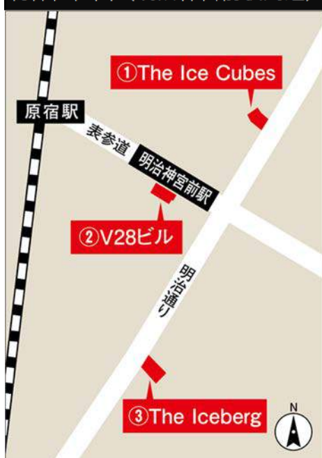
物件位置図（明治神宮前駅周辺）